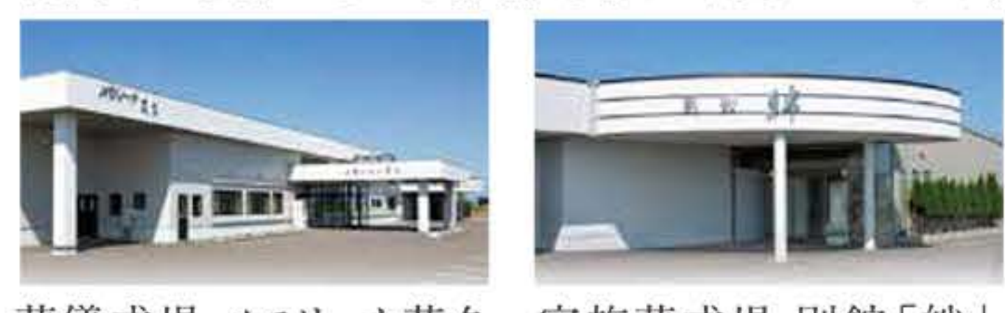
葬儀式場 メモリーナ花久 家族葬式場 別館「絆」